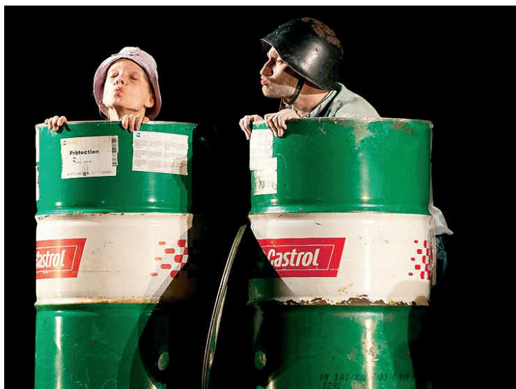
Chorzy na stwardnienie rozsiane aktorzy duńskiego Teaterforeningen Slutspil w „Końcówce” Becketa

sce jest nieprzewidywalna: było zimno, padało, wiało. Zapewne aura spowodowała, że nawet na spektakl Teatru Nowego Fronta, jeden z najbardziej dzisiaj znanych w Europie zespołów przyszło kilkanaście osób. Dlatego w tym roku wrócono do majowego terminu, niestety widzów było niewiele więcej.